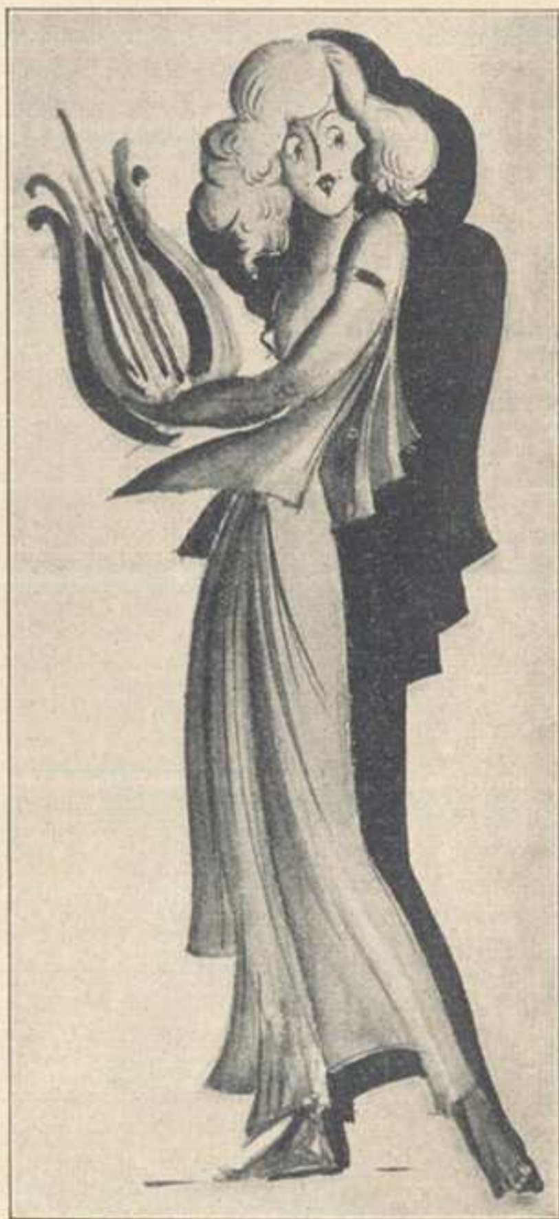
Czy mam ci coś zaśpiewać?...

Właściwie nie obudziłem się sam, lecz z pomocą dozorca, który długo potrząsał mnie za ramiona, wołając: