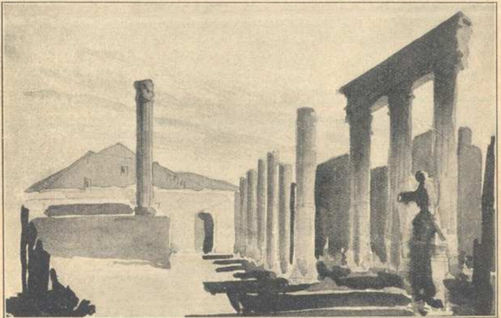
Zwaliska Pompei skąpane w tęczowym blasku..

Dwukrotnie odzyskiwałem przytomność. Za drugim razem zerknąłem na zegarek. Była godzina 6 rano. Zdażyłem zrzucić ubranie i wdziać pyjamę. Podszedłem do okna, odsunąłem firankę i głośno krzyknąłem z zachwytu. Zwaliska Pompei były skąpane w tę-