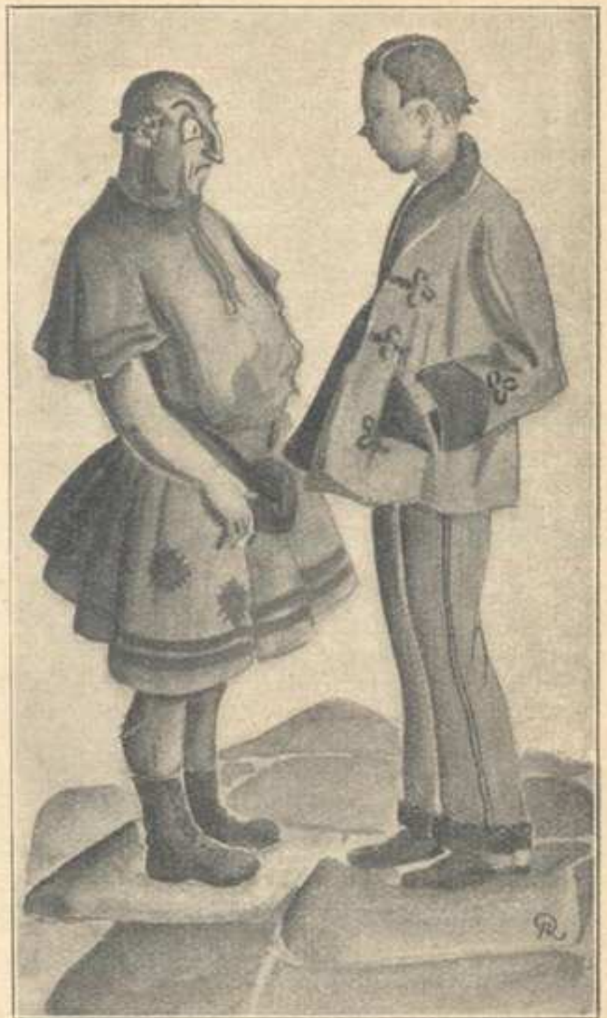
Zastąpił mu drogę, młody człowiek...

— To może będziesz wiedziała jaki obecnie panuje imperator?